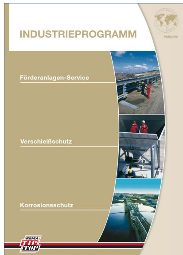
Produktkatalog in 5 Sprachversionen, Deutsch